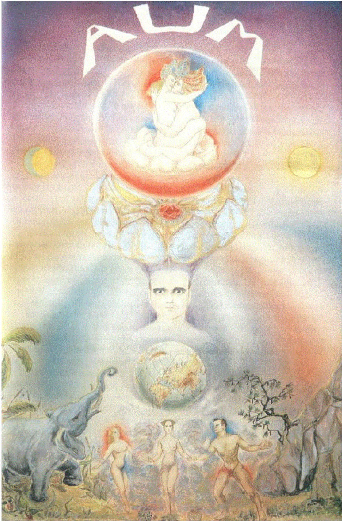
OBRAZ MÁGA PRVNÍ TAROTOVA KARTA